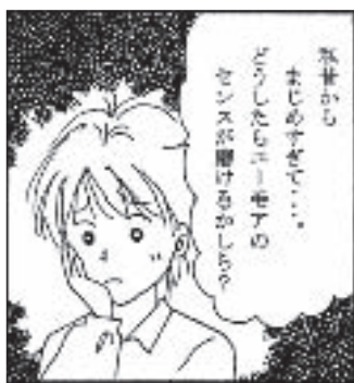
ユーモアのセンスを磨く